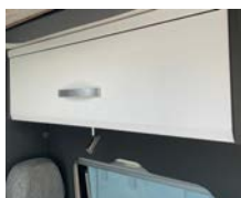
+ Möbeldekor Amberes Oak