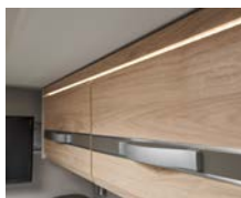
+ Möbeldekor Noce Nagano