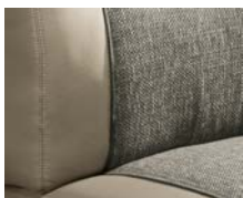
+ Wohnwelt Camino