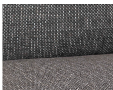
+ Verhoilu Floyd