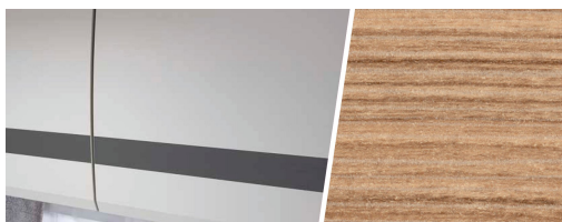
+ Kalustesävy Rosario Cherry