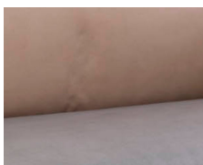
+ Verhoilu Duke *