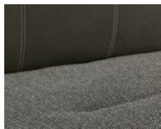
+ Verhoilu Gresso *