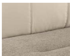
+ Verhoilu Torcello