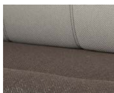
+ Verhoilu La Rocca *