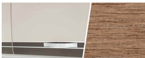
+ Kalustesävy Virginia Eiche