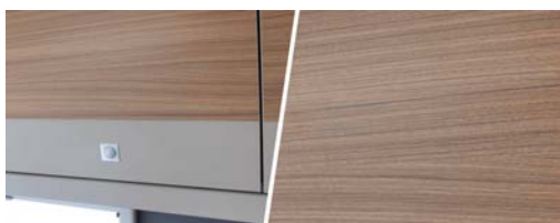
+ Kalustesävy Rosario Cherry