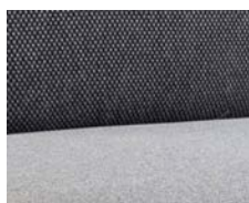
+ Verhoilu Galaxy *