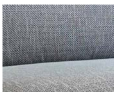
+ Verhoilu Cloud