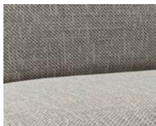
+ Verhoilu Mount *