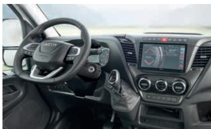
» Kattavat varusteet ohjaamossa