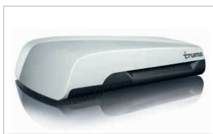
» Tehokas kattoilmastointilaite (lisävaruste)