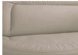
+ Meran (aito nahka, lisähinta)