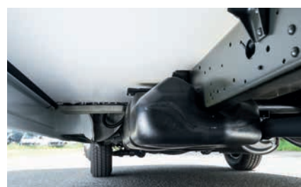
» Lasikuituinen alapohja