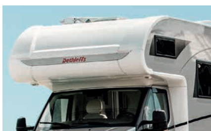
» Tilavassa alkovissa on 200 x 155 cm kokoinen vuode