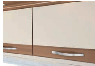
+ Almeria-saarni / white