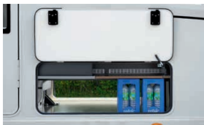
» Säilytystilaa kaksoispohjassa