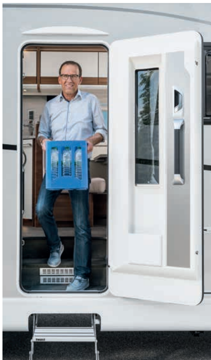
» Tukevassa ulko-ovessa suuri ikkuna