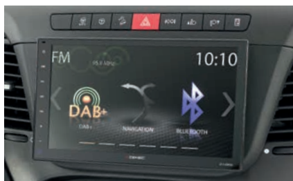
» Dethleffs Naviceiver -multimedialaite sis. DAB+ (lisävaruste)