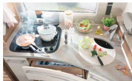
» Käytännöllinen keittiötaso, jossa tila kahvinkeittimelle