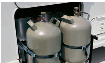
» Helppokäyttöinen kaasupullovaunu