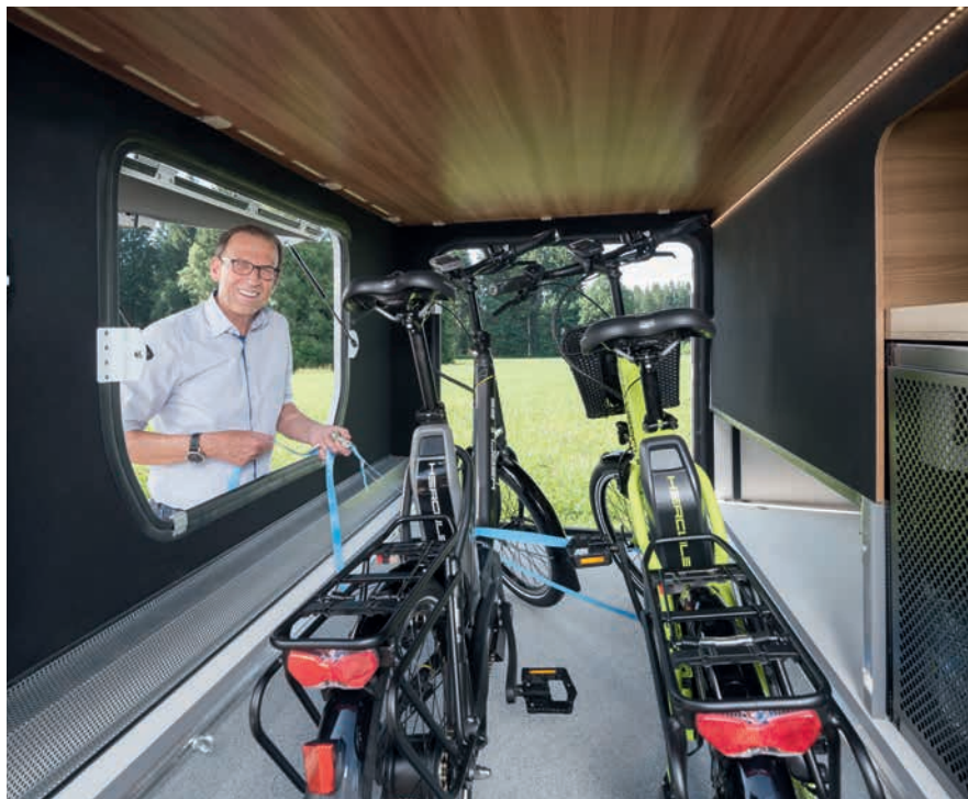
» Suureen takatalliin on saatavana kolmas luukku auton takaseinään