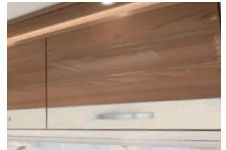
+ Almeria-saarni / Gloss (lisähinta)