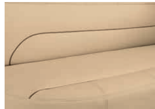
+ Skylight (aito nahka, lisähinta)