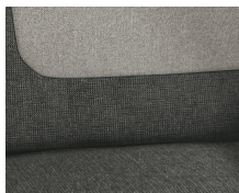
+ Calypso-verhoilu, sis. ohjaamon istuimien verhoilun ○