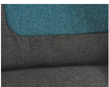
+ Salerno-verhoilu, sis. ohjaamon istuimien verhoilun