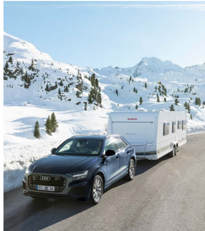
Turvallista talvimatkailua Dethleffsin talvimatkailuun varustellulla matkailuvaunulla.