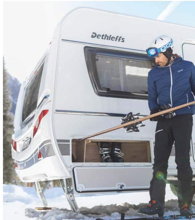
Loma-asunto aivan rinteiden vieressä, ja sisällä on yhtä lämmintä ja mukavaa kuin kotona.

Näiden pitkän kokemuksen perusteella kehitettyjen varusteiden ansiosta matkailuvaunu pysyy kotoisan lämpimänä myös kylminä pakkasöinä ja vesilaitteisto ei jäädy.