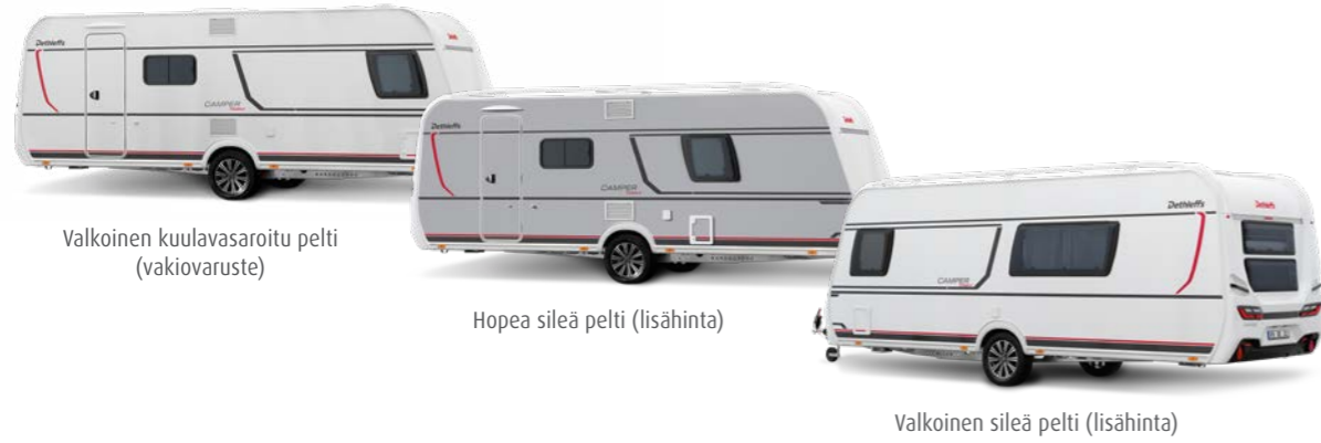
Valkoinen kuulavasaroitu pelti (vakiovaruste)